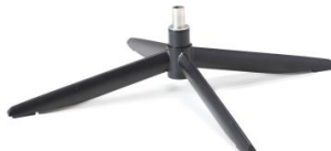
Fuß 72 4-Sternfuß schwarz