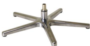
Fuß 83 5-Sternfuß Aluminium