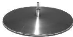
Fuß 27 Teller Edelstahl