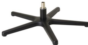
Fuß 84 5-Sternfuß schwarz