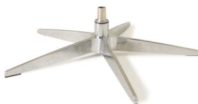
Fuß 33 5-Sternfuß Edelstahllook