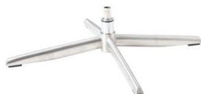
Fuß 71 4-Sternfuß Aluminium