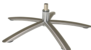
Fuß 85 5-Sternfuß Edelstahl Nicht geeignet für Twice Pro