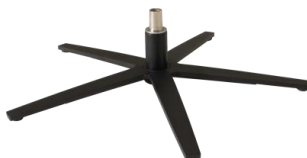
Fuß 87 5-Sternfuß Edelstahl schwarz

Achtung: Um den Fußboden vor Kratzer zu schützen, bitten wir Sie darauf zu achten, dass der jeweilige Fußboden geschützt wird durch gesondertes Unterlegen unter die Standardfußvarianten des Herstellers.