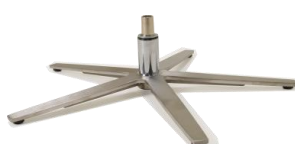
Fuß 86 5-Sternfuß Edelstahl