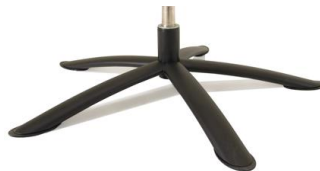
Fuß 88 5-Sternfuß Edelstahl schwarz Nicht geeignet für Twice Pro