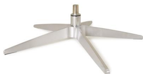
Fuß 31 5-Sternfuß Aluminium