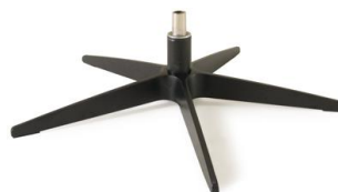
Fuß 32 5-Sternfuß schwarz