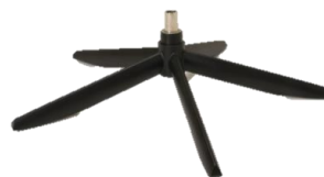
Fuß 42 5-Sternfuß Edelstahl schwarz