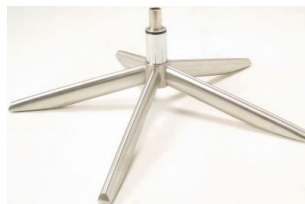
Fuß 41 5-Sternfuß Edelstahl